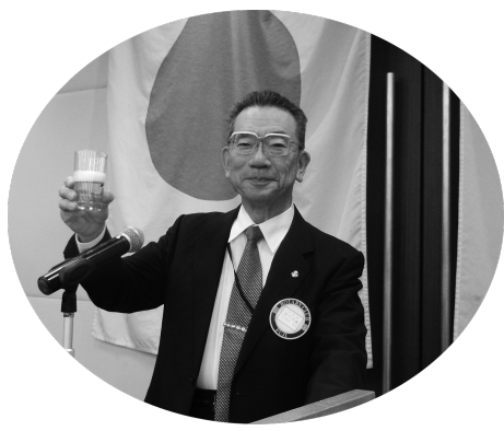
宮下会長による乾杯!