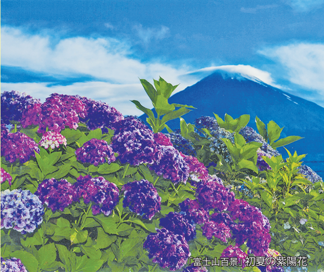
「富士山百景」初夏の紫陽花