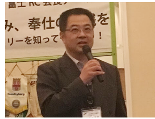
富士商工会議所中小企業相談所