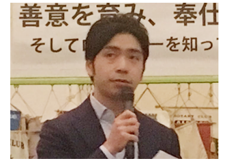
富士商工会議所経営相談課