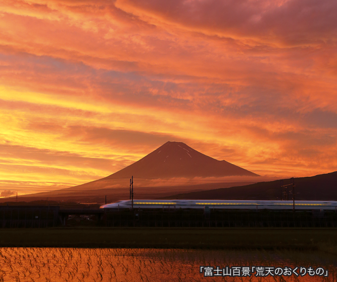
「富士山百景「荒天のおくりもの」