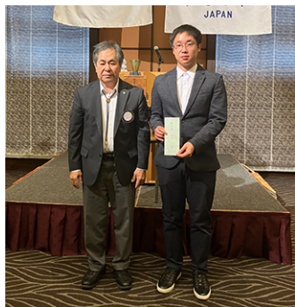
ジェホ君に奨学金の渡し