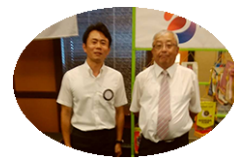
誕生日 おめでとう ございます