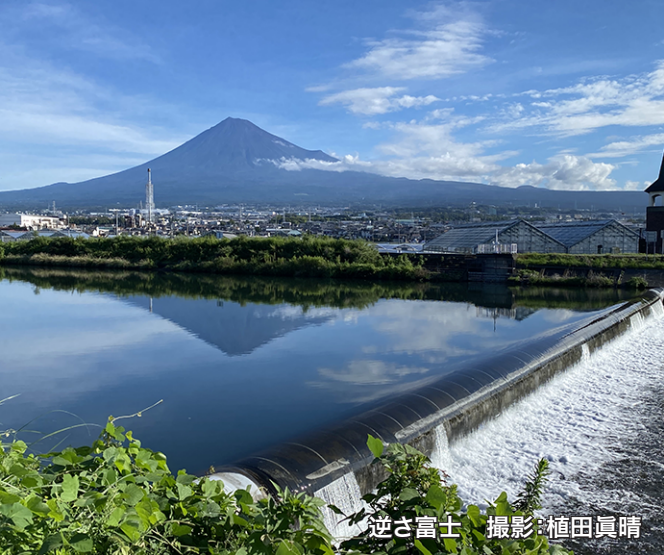
逆さ富士