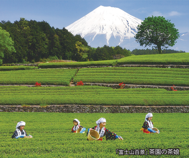
「富士山百景」茶園の茶娘