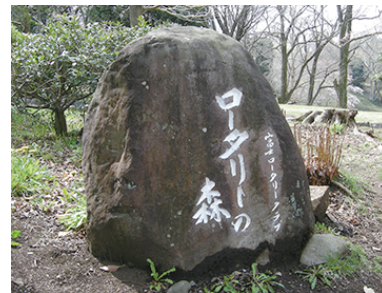
ロータリーの森記念碑