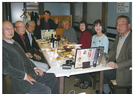
27年度前期成績発表会