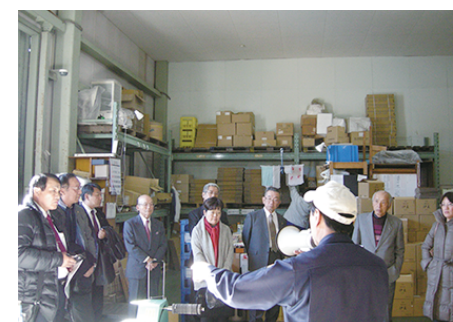
日本酒の箱詰め工程