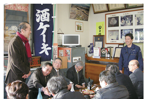
太田会長より、清社長様への謝辞