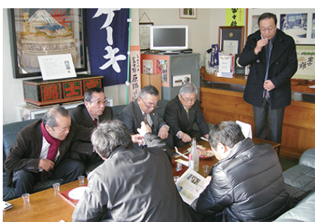
試飲会 新酒から純米大吟醸まですべてを頂きました