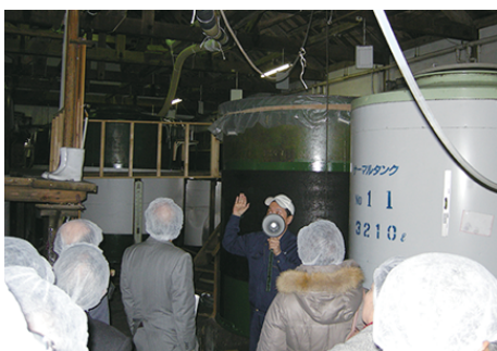
醸造用ホーロータンク