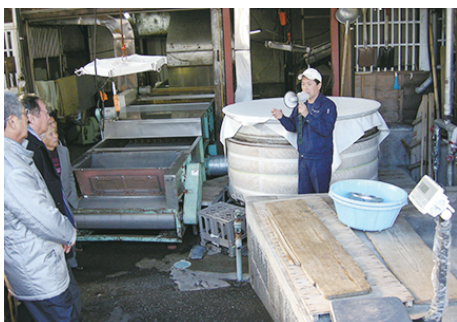
酒造米用の蒸し釜