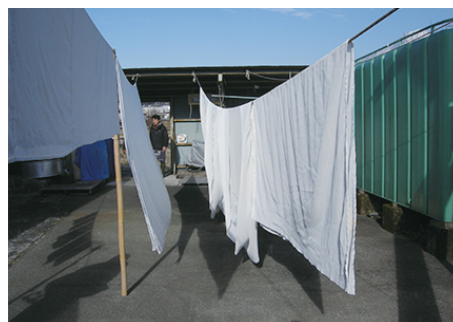
蒸し米を担いで運ぶ布袋