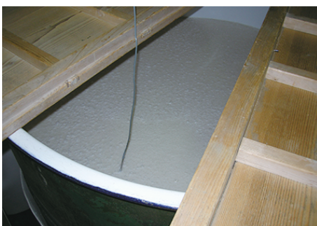
醸造中のタンク内部