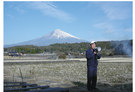
この畑の下の富士山伏流水を使用