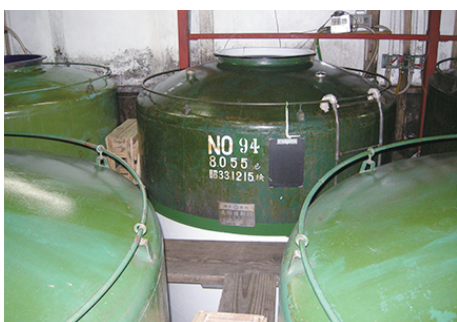
貯蔵タンク容量約8キロリットル