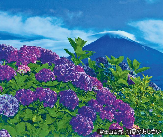
「富士山百景」初夏のあじさい