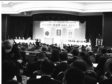
地区協議会全体会議