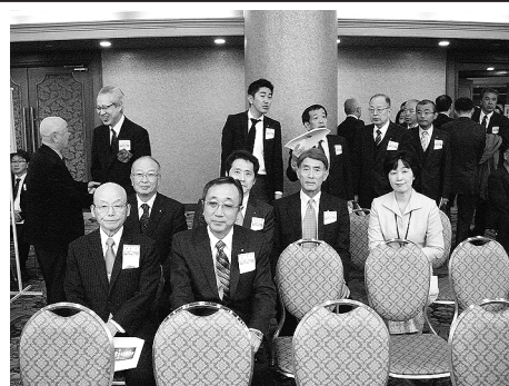
地区協議会参加者