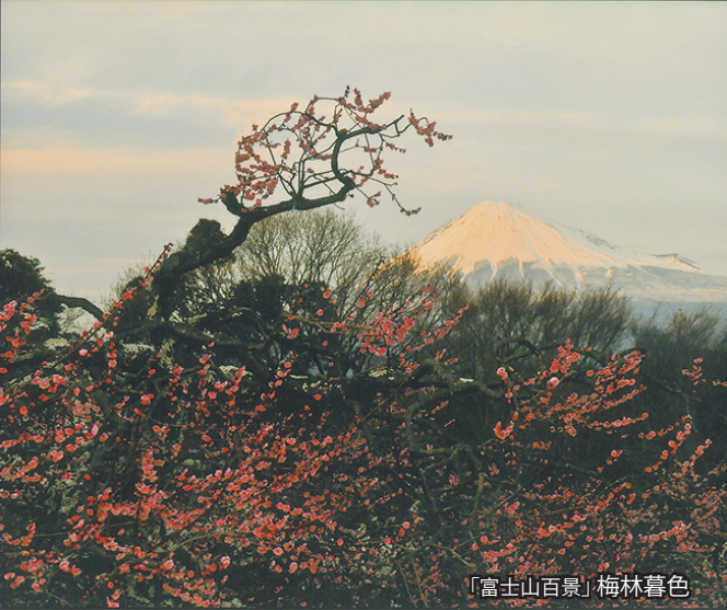
「富士山百景」梅林暮色