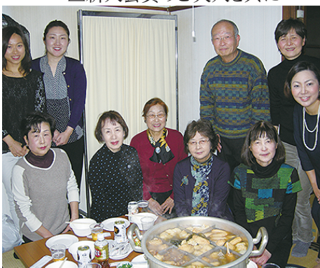
△お手伝いのご夫人方