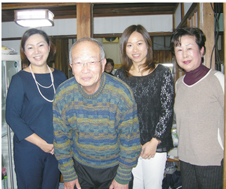
△新入会員のご夫人と共に