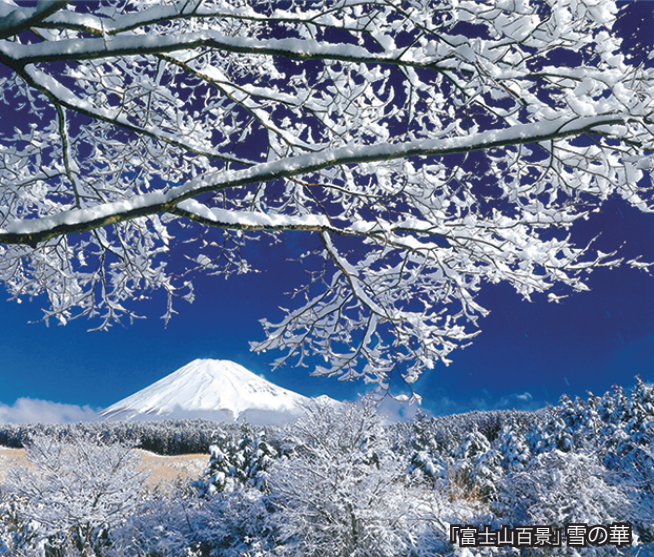
「富士山百景」雪の華