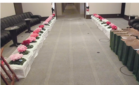
磯西会員より立派な写真を提供していただきました シクラメンの鉢植えを全会員に頂きました