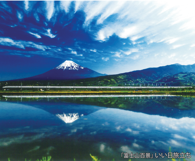
「富士山百景」いい日旅立ち