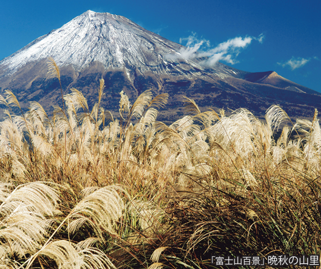
「富士山百景」晩秋の山里