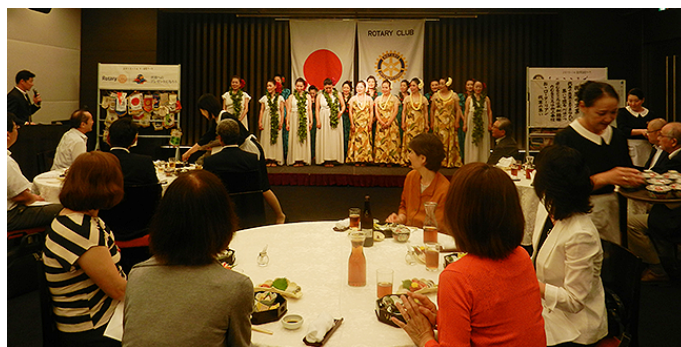
フラダンス「フラナニズマウントフジ」