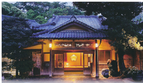
伊豆天城湯ヶ島温泉 落合楼村上

日時 平成29年6月7日(水) 19時00分 場所 伊豆天城湯ヶ島温泉 落合楼 村上 伊豆市湯ヶ島1887-1 TEL0558-85-0014 会費 宿泊される方 30,000円 日帰りの方 20,000円