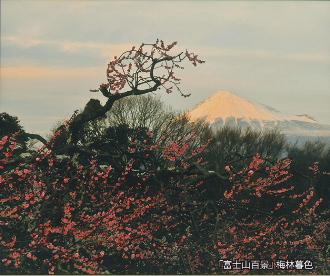
「富士山百景」梅林暮色