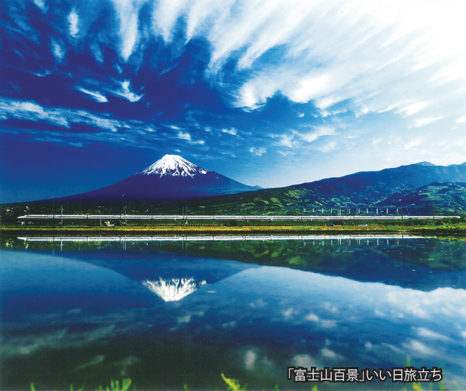
「富士山百景」いい日旅立ち