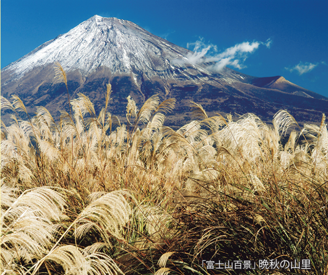
「富士山百景」晩秋の山里