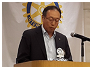
プログラム委員会

私は会員の役割はロータリーの理念に従って自分自身を律し、事業を行う事、そして自己の職業上の手腕を社会の問題やニーズに役立てるためにクラブが開発したプロジェクトに応えることだと思います。自分の職業上のスキルを生かした奉仕活動は個人が行うものであれ、クラブが行うものであれすべて立派な職業奉仕の活動として活発に実践する事です。