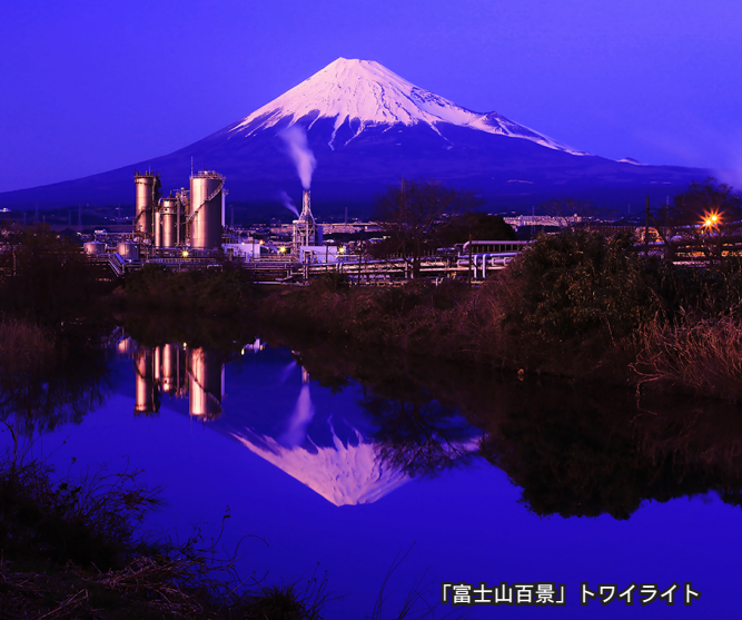
「富士山百景」トワイライト