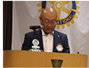
親睦・出席委員会