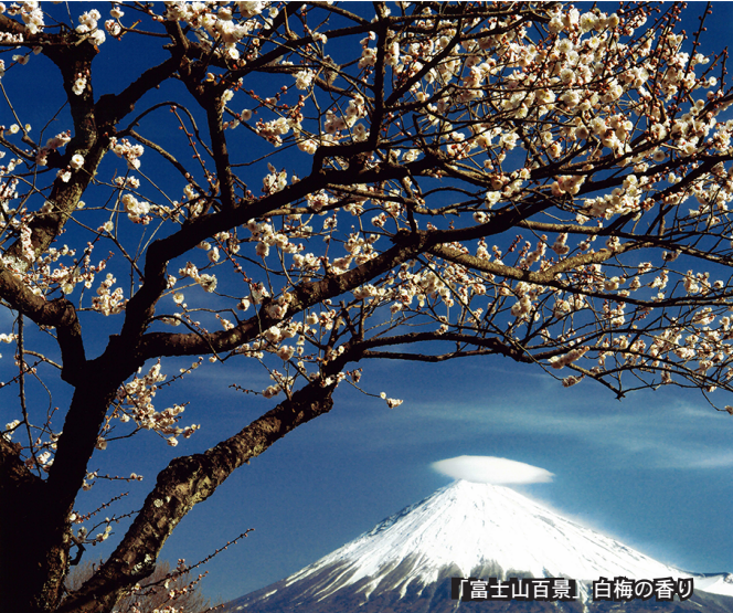
「富士山百景」白梅の香り