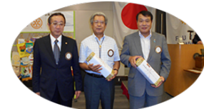
お誕生日 おめでとう ございます