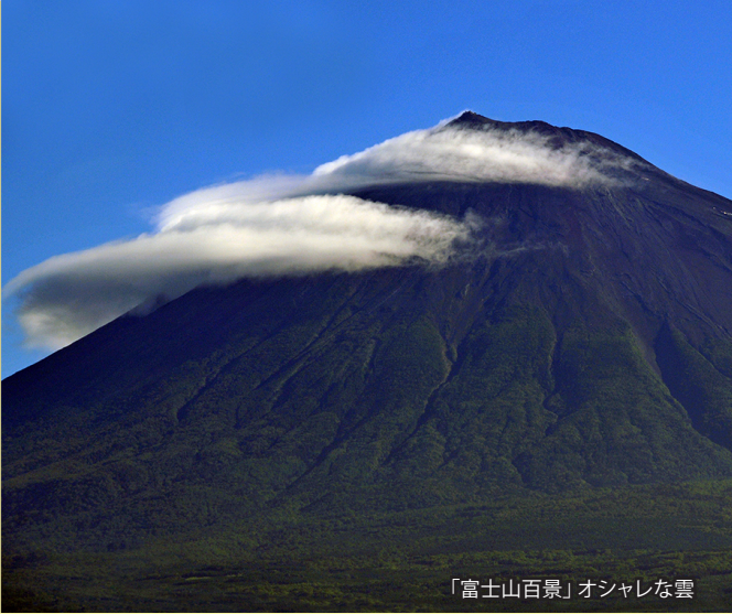
「富士山百景」オシャレな雲