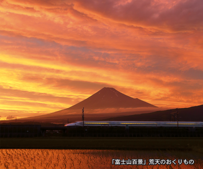
「富士山百景」 荒天のおくりもの