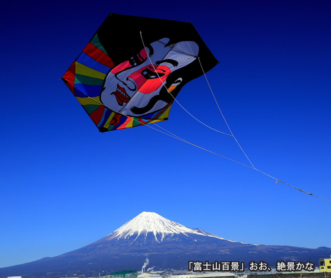
「富士山百景」おお、絶景かな