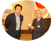
お誕生日おめでとうございます