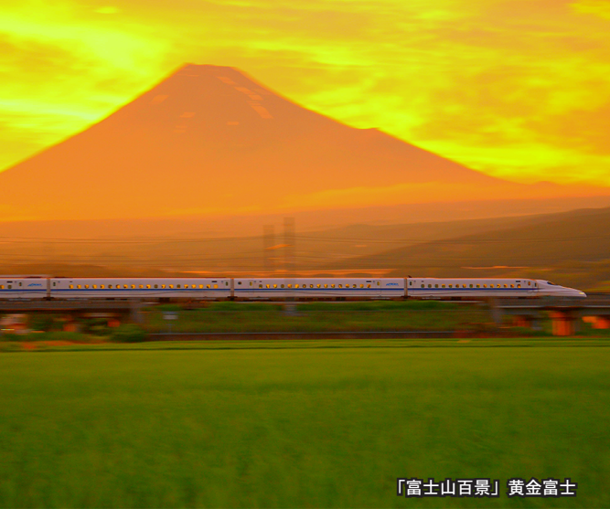
「富士山百景」黄金富士