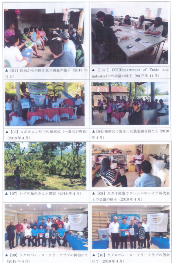
▲【01】住民からの聞き取り調査の様子(2017年11月) ▲【02】DTI(Department of Trade and Industry)での会議の様子(2017年11月)

事業内容: フィリピン・レイテ島のカポオカン町は、都市部から離れた海山に囲まれた地域であり、元々貧しい生活を強いられていることに加え、2013年11月の台風により地元の産業が大きなダメージを受け、困窮状態に陥