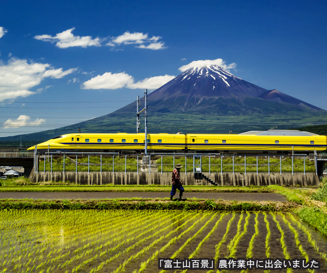
「富士山百景」農作業中に会いました