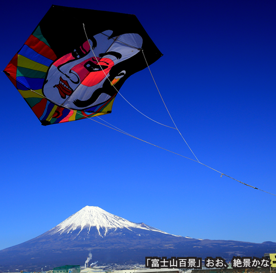
「富士山百景」おお、絶景かな