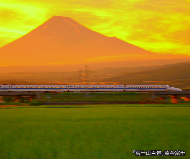
「富士山百景」黄金富士