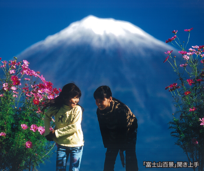
「富士山百景」聞き上手