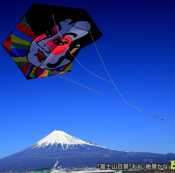
「富士山百景「おお、絶景かな」」