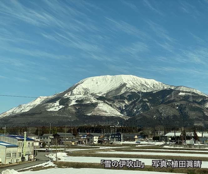
『雪の伊吹山』