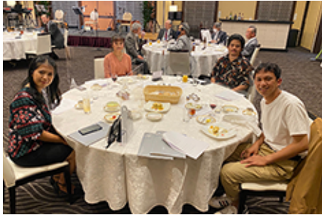
▲本日のゲストは、バンドグループ「スマルナ&フレンズ」の皆様