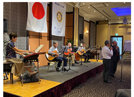
▲そして締めは「思い出の渚」