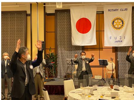
エアー「手に手」でお開きとなりました。「ロータリークラブに入っていてよかったなあ」と感じた一時でした。