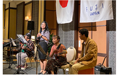
▲ロッドスチュアートの名曲や「STAND BY ME」、ビートルズ他一青窈のハナミズキなど日本の歌も披露し彼等彼女たちの多才ぶりに感動させられた。