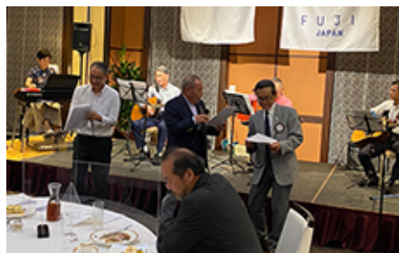
ビートルズあり「Imagine」の朗読あり盛りだくさんのメニューの中、アンコールは「青春時代」