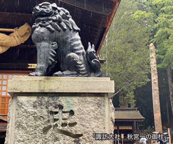
「諏訪大社 秋宮一の御柱」