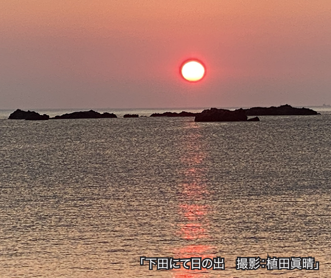
「下田にて目の出」