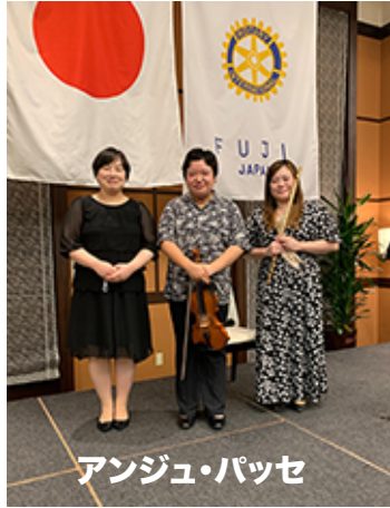
アンジュ・パッセ