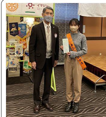
スミルナさん 奨学金授与