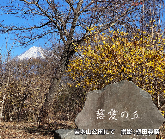
岩本山公園にて