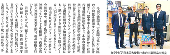
在ラトビア日本国大使館へ市内企業製品を贈呈

富士市とラトビア共和国はボイイスカウトとの関わりを縁、東京の2020オリンピックパラリンピックのスタジアム建築や、相互訪問を通じて交流を続けており、令和5年には富士まつりで日本初上陸となるクラフティ・ピノの社(ラトビア)製ウエッジ・ピノの披露と披露が行われ、8月にはクレデーイ市から市長(右)が本市を訪れ、教育施設や再生エネルギー施設、ICT関連企業等の視察が行われました。