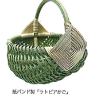
紙バンド製「ラトビアかご」

作りやぶらむを編むという文化は両国で共通し、手芸用紙に加えて、紙で作られるさまざまな色紙や紙の活用にも関心が高まっています。また、紙の活用は、環境への配慮も高まっています。