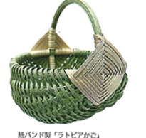
紙バンド製「ラトビアかご」

植田産業株式会社 富士市依田町174-1 TEL0545333210 手芸紙バンド専門店 Papires Shop 植田産業株式会社ホームページ