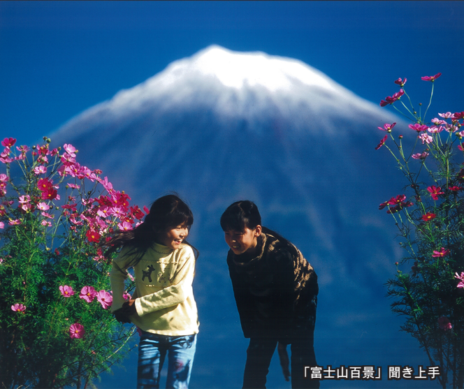
「富士山百景」聞き上手