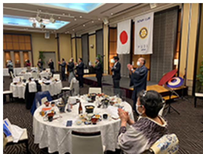
最後はエア-「手に手」を歌い新年祝賀会は盛況に終わりました。