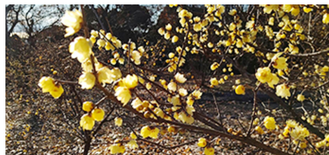
蟬梅満開/岩本山公園にて