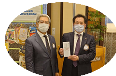
お誕生日 おめでとうございます