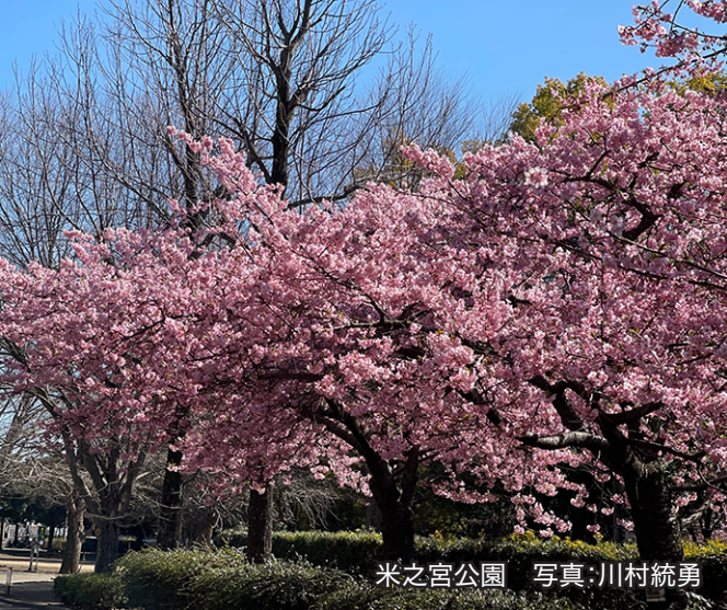
米之宮公園