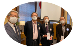
ご家族お誕生日 おめでとうございます